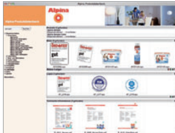
Medien- und Produktdatenbank Alpina

Wir gewährleisten Ihnen eine kompetente Beratung und reagieren schnell auf Ihre jeweiligen Anforderungen und Wünsche.